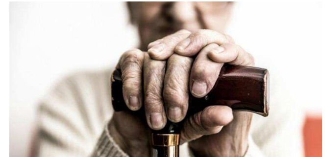
Personas mayores solas