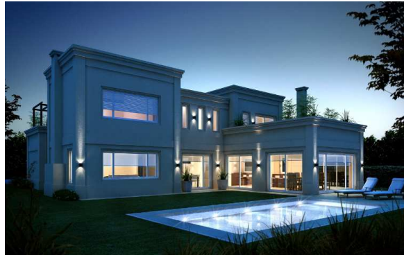
Seguridad de la vivienda