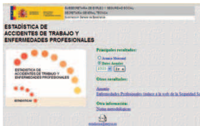
Imagen 1. Pantalla de acceso a las estadísticas del MEySS.

La problemática de utilizar estos datos para obtener conclusiones que permitan plantear acciones que ayuden a reducir esta siniestralidad radica en que, para ello, se necesitan excesivos recursos para relacionar los distintos datos, trabajando, en su mayor parte, con tablas Excel. Además, estas tablas incluyen, exclusivamente, las referencias de los distintos registros publicados en Delta y no se relacionan con otras bases de datos (a excepción de la base relativa al número de trabajadores afiliados a la Seguridad Social) que permitan obtener un mayor grado de información.