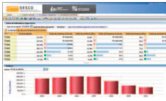
Imagen 4. Variación del índice de incidencia 2004-2010.

pertencen a empresas de otras provincias. Todos ellos con la posibilidad de llevar a efecto, como ya se ha dicho anteriormente, multitud de variaciones y adaptaciones modificando distintas variables (lugar del accidente, grado de la lesión, fechas, etc.).