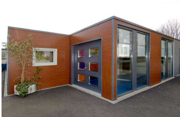
Centros de enseñanza