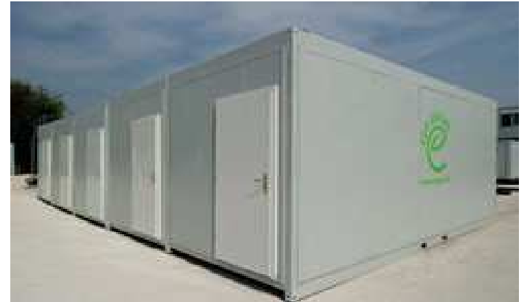
Módulo Eco-Future Francia