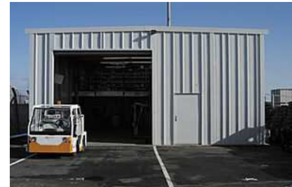
Espacios para almacenaje