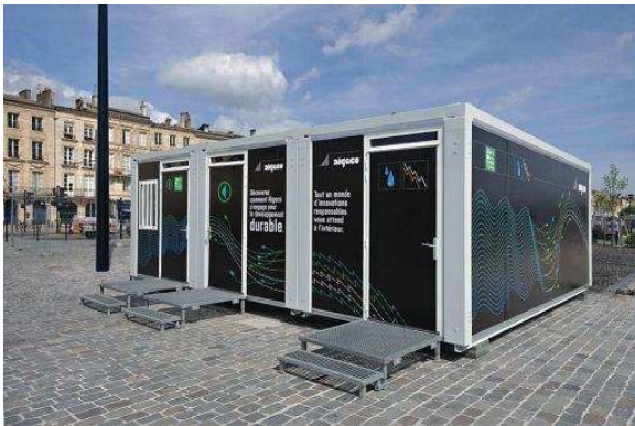
Instalaciones para eventos