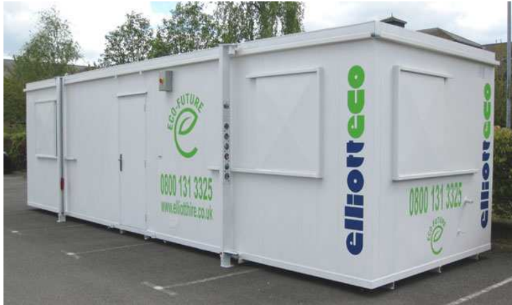
Módulo Eco-Future UK