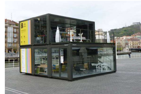
Oficinas de información