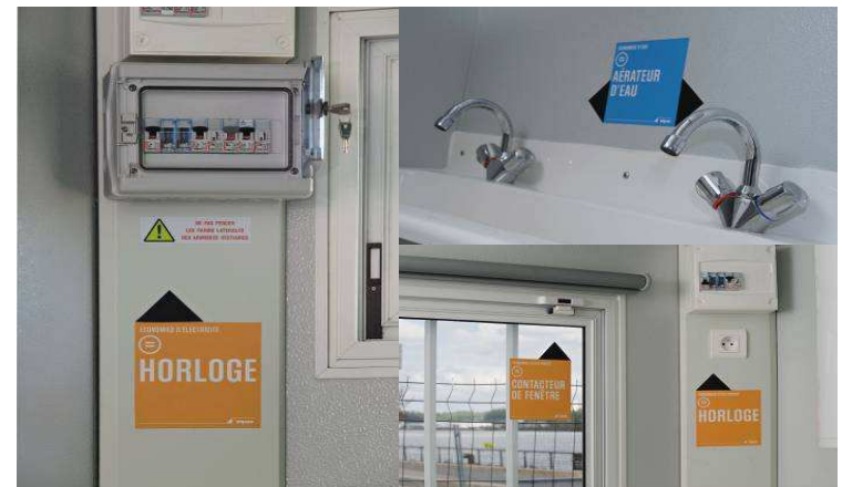
Packs de eficiencia energética