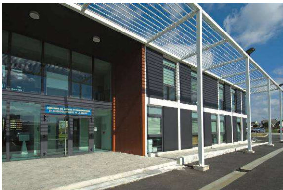
Centros de I+D