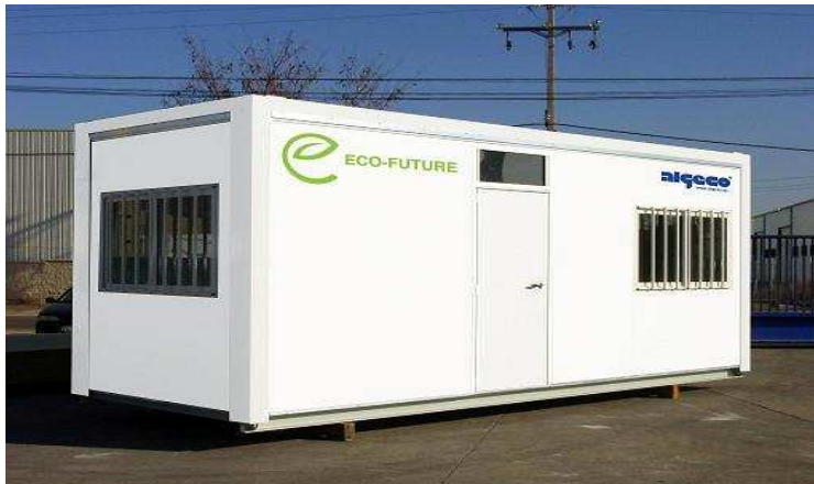
Prototipo Eco-Future España (desarrollándose)