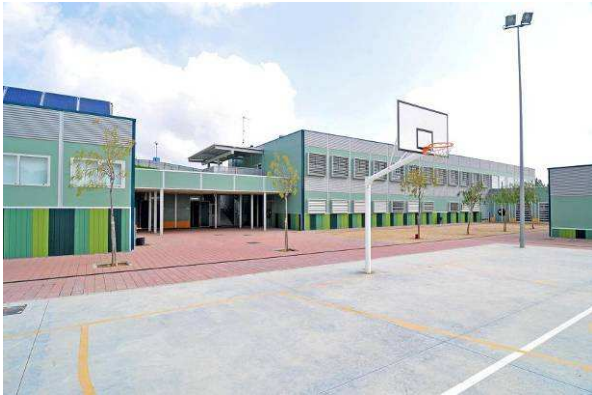
Centros de enseñanza