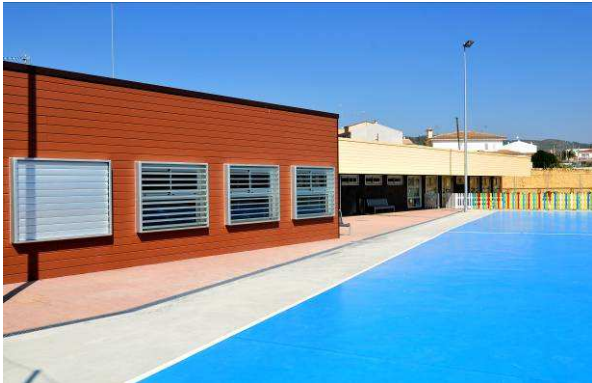
Centros de enseñanza