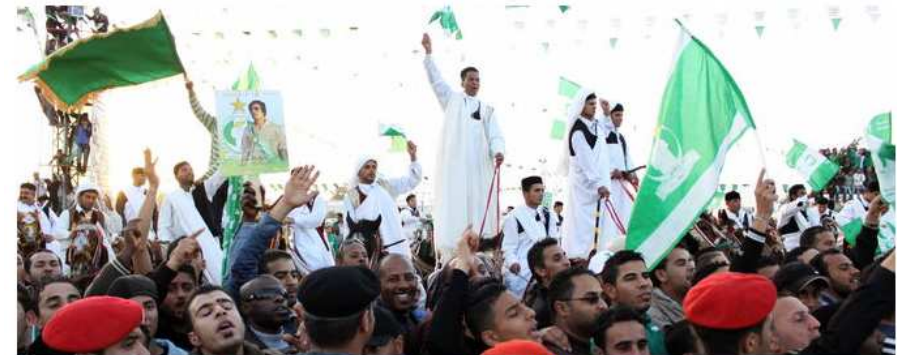
Seguidores animaban ayer al líder libio Muamar Gadafi.

Expectación ante la llamada realizada desde las redes sociales, que insta a los libios a manifestarse hoy contra el régimen de Muamar el Gadafi.